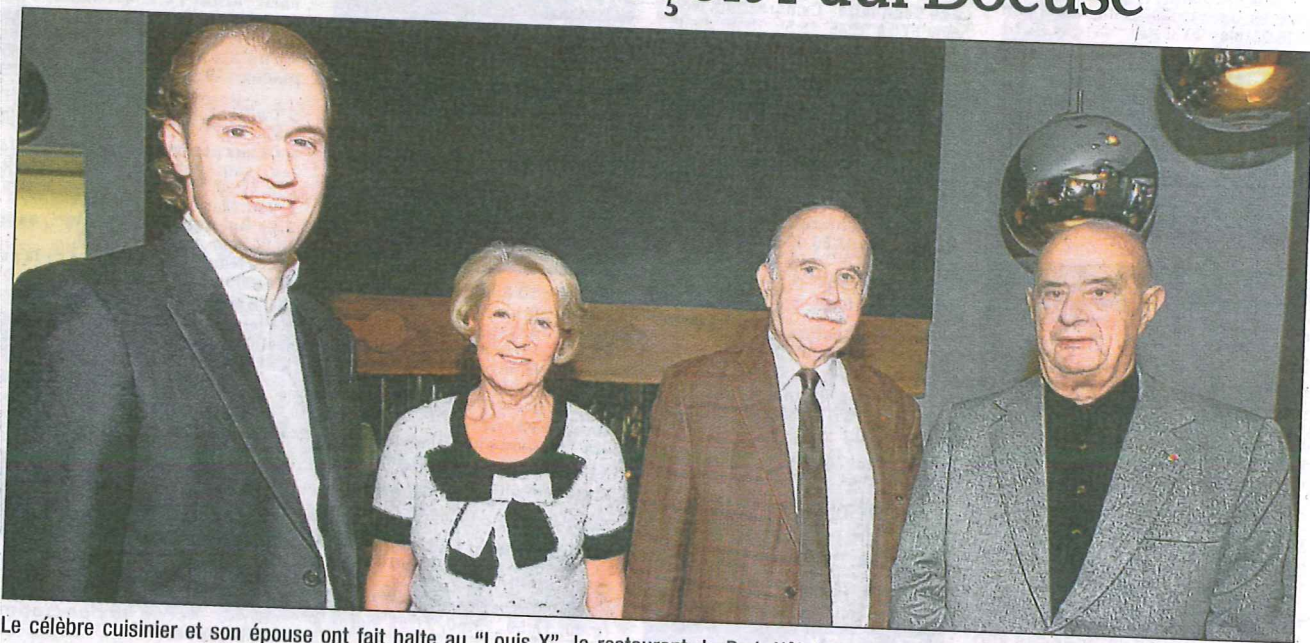
Le célèbre cuisinier et son épouse ont fait halte au "Louis X", le restaurant du Park Hôtel dirigé par la famille Ducret.